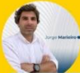
Jorge Marieiro Marieiro Seguros